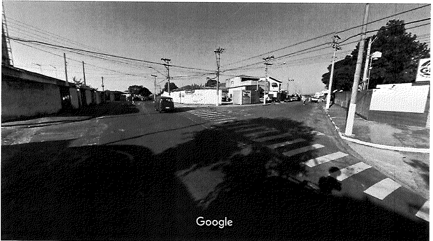
Captura da imagem: ago 2011 © 2016 Google